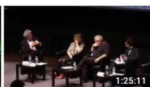
2019 JALMALV CONGRES LORIENT SOIREE GRAND P...