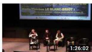
2019 JALMALV CONGRES LORIENT AUTRES REGARDS