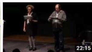
2019 JALMALV CONGRES LORIENT SEQUENCES INTR...