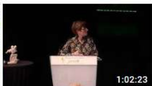
2019 JALMALV CONGRES LORIENT PERSPECTIVES