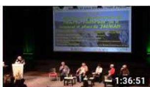
2019 JALMALV CONGRES LORIENT ECHANGES INTER...