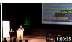
2019 JALMALV CONGRES LORIENT PANORAMA INTE...