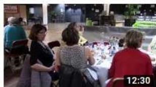
2019 JALMALV CONGRES LORIENT SOIREE GALA

https://www.youtube.com/channel/UCqJaAbttsFi1j5h3EX6jwbG/videos