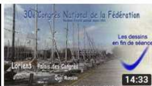
2019 JALMALV CONGRES LORIENT DESSINS