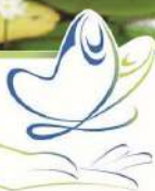
Tableau 2 - SUBVENTIONS