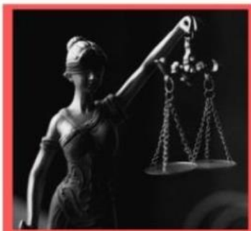
Illustration Caroline 2019, AP